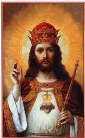
Jezu, jesteś Królem!

5. W pierwszą sobotę na mszy św. o godz. 8.00 modlimy się za rodziny, które spodziewają się potomstwa. Na tę mszę św. zapraszamy zwłaszcza tych, którzy podjęli się duchowej adopcji dzieci, jak również wspólnotę Rycerstwa Niepokalanej. O 18.00 msza św. ku czci św. Jana Pawła II. Po mszy św. pro-